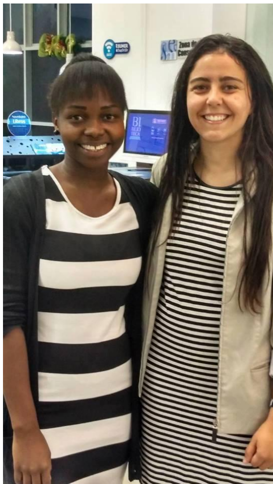
Marjorie de Kenya y Ola de Egipto